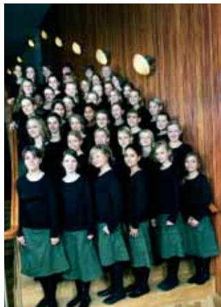
DR Radiojuniorkoret.

DR Radiojuniorkoret fungerer som et "aspirantkor" til Radiopigekoret. Der skal arbejdes målrettet, og man skal kunne spille et instrument for at komme med i juniorkoret. Samtidig er der også tid og plads til at udvikle sig. Det er planen, at koret også skal inddrage rytmisk repertoire og til tider også repertoire med dramatisk karakter. Koret skal holde deres egne koncerter, lave indspilninger til radioen og medvirke i blandt andet DR Radiopigekorets Julekoncerter.