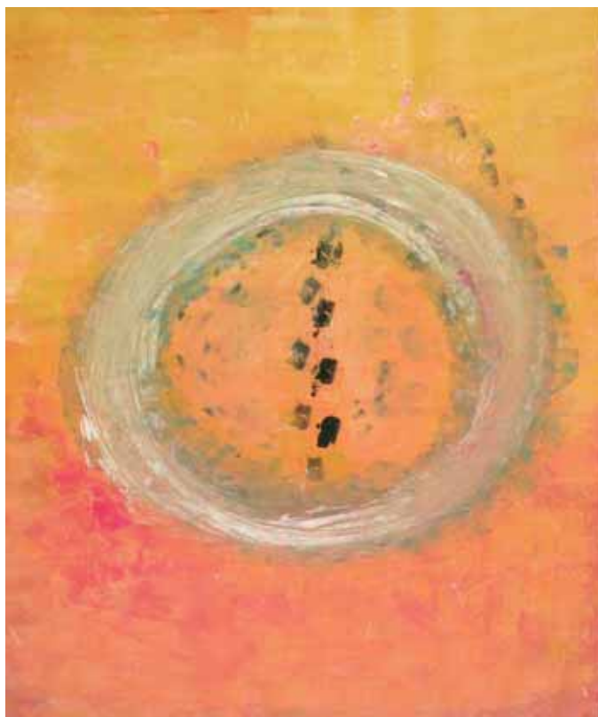
Maleri af Nanne Larsen.